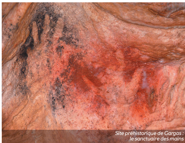
Site préhistorique de Cargas : le sanctuaire des mains

www.ens-lyon.fr/formation/departements-et-centres