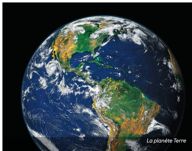
La planète Terre

Quels sont donc alors ceux qui s'emploient à philosopher si ce ne sont ni les sages ni les ignorants ? la chose est claire ! ce sont ceux qui sont intermédiaires entre ces deux extrêmes et au nombre desquels doivent se trouver ceux qui sont capables de désir ! (Platon, Banquet, 204b)