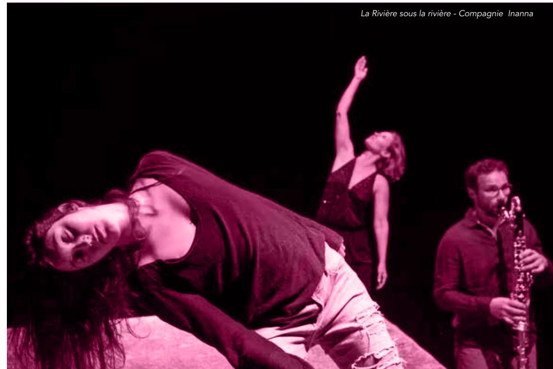
La Rivière sous la rivière - Compagnie Inanna

Née en 2003, Greta Thunberg est une jeune suédoise, activiste pour le climat dès ses 15 ans. Initiatrice de la « grève de l'école pour le climat » en novembre 2018, les médias commencent à s'intéresser à elle. Remarquée par son intervention à la Cop 24 à Katowice en décembre 2018, elle devient une figure emblématique de l'investissement des jeunes générations pour la cause climatique. Elle poursuit ses interventions pour faire avancer cette cause recueillant d'importants soutiens mais essayant également de nombreuses critiques pour ses prises de positions jugées alarmistes. Quoiqu'il en soit, par sa médiatisation, il y a bien un « effet Greta Thunberg » permettant de porter la question climatique au devant de l'actualité mondiale.