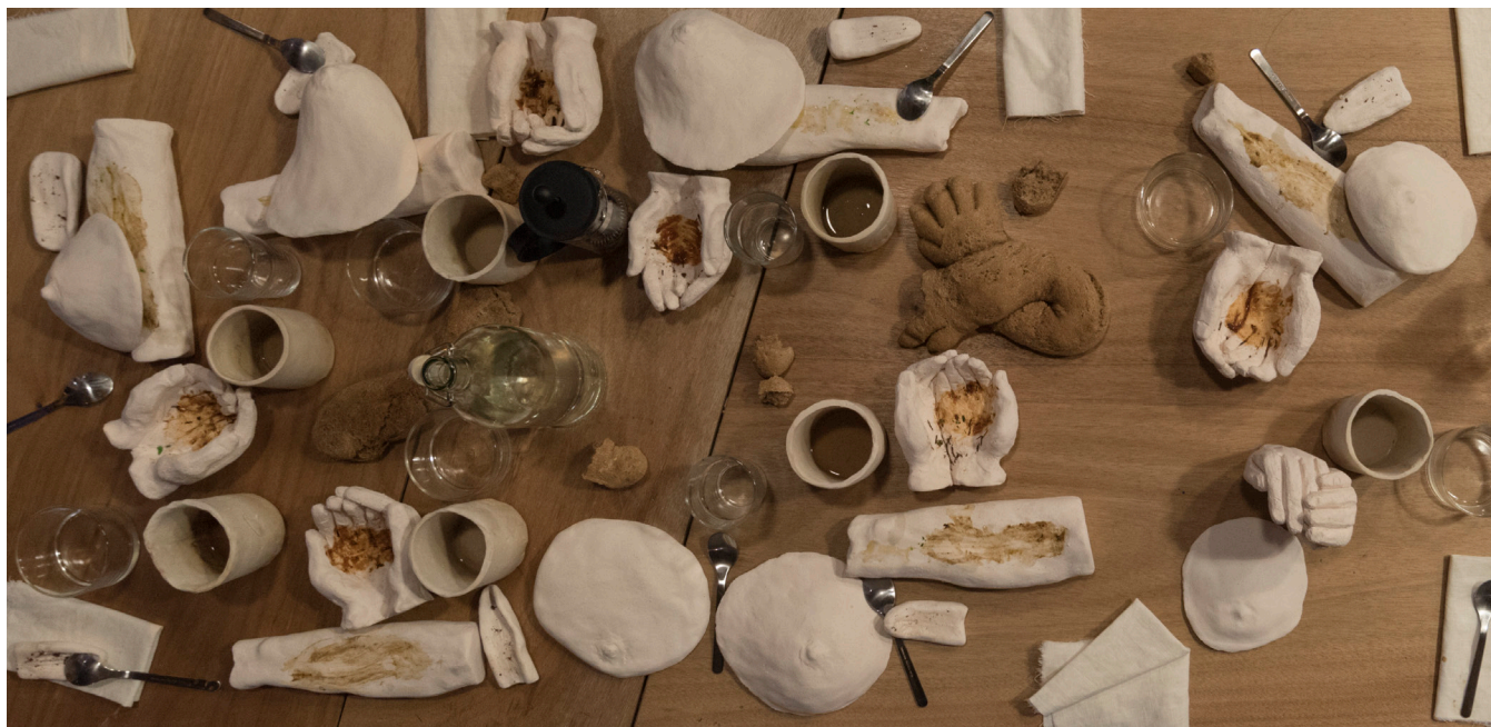
Sympathie, contagion et similitude, 2019. Détails.