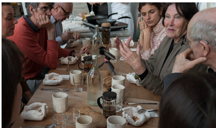
Sympathie, contagion et similitude , 2019. Table ronde / diner le 30 avril 2019 en collaboration avec Antonia Klugmanna, accueillie par le Paris Art Lab. Production MOCO – Montpellier contemporain pour l'exposition Cookbook'19 à La Panacée.

Ancré dans la réflexion de Tim Ingold où l'enseignement est fondé sur des pratiques de gestes de fabrication, ce projet est l'occasion de se confronter à l'anthropologie, l'archéologie, l'art et l'architecture « comme manières de faire qui explorent chacune, à leur façon, les conditions et les potentiels de la vie humaine au sein de son environnement ». T.C.