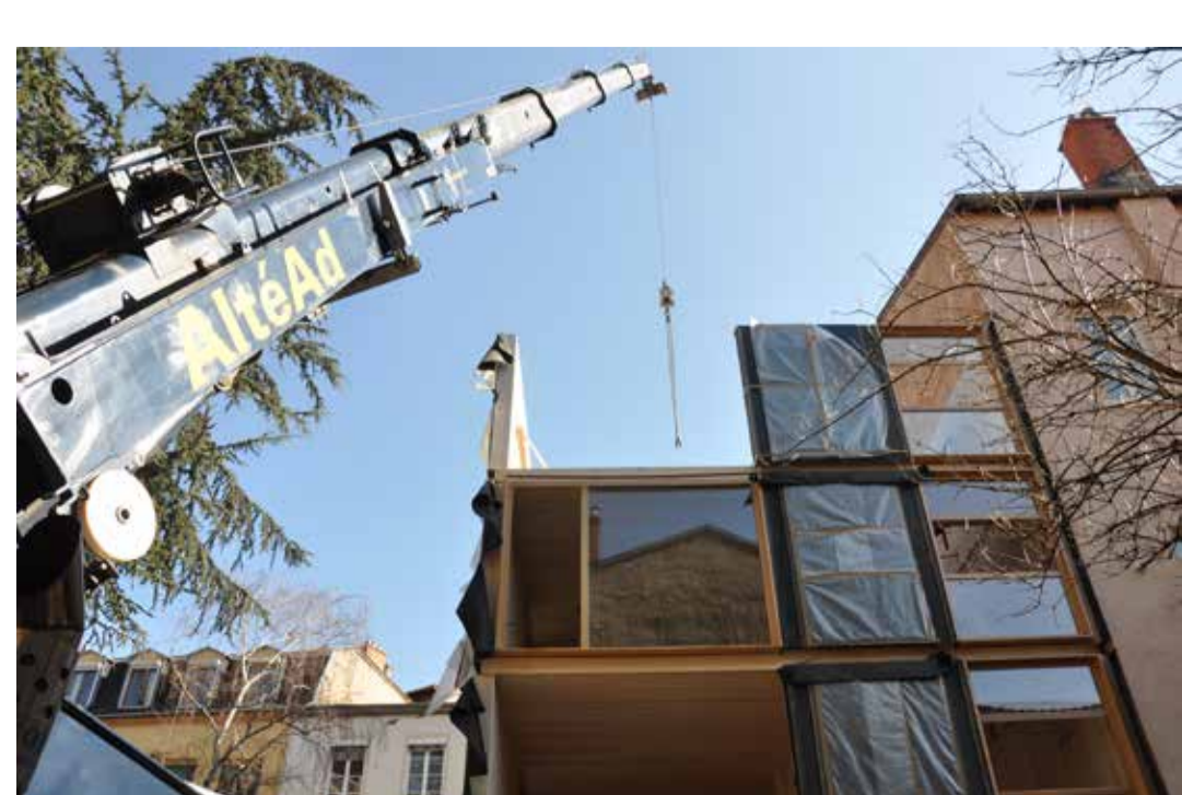
Construction de la maison en bois de l'architecte Alain Vargas, Lyon 2010