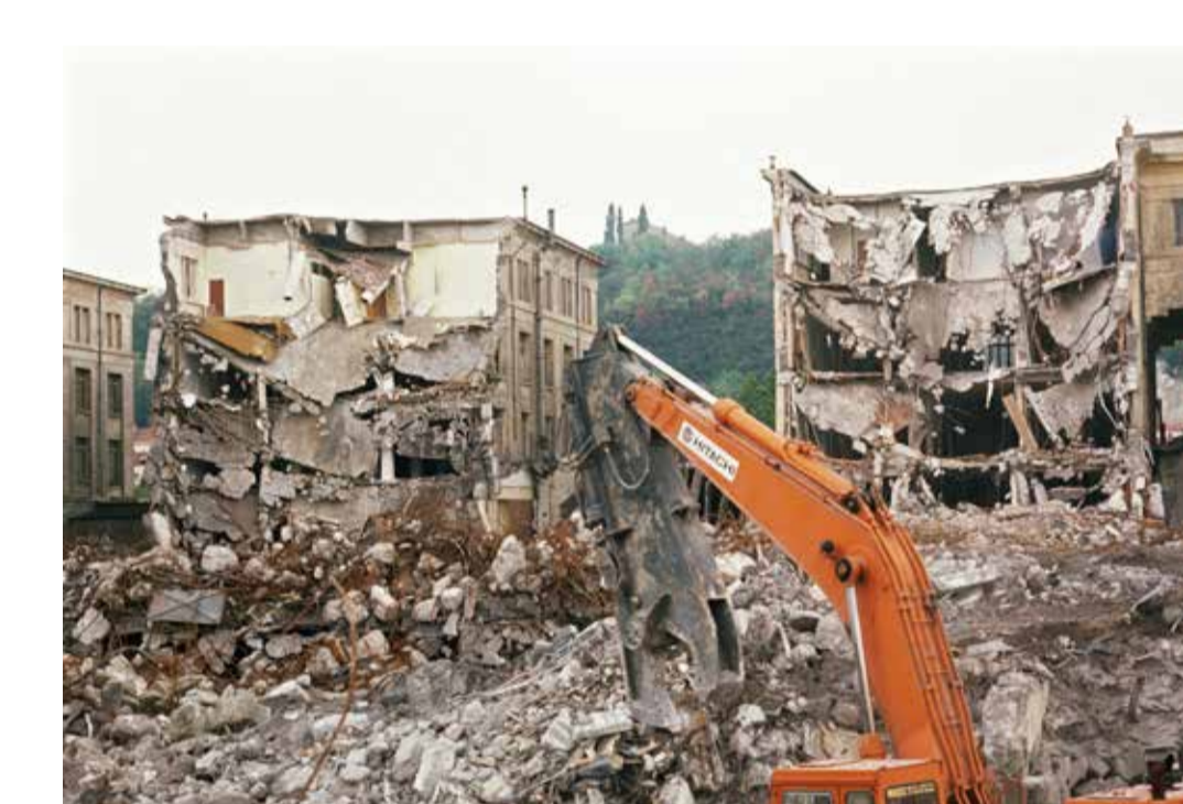
Démolition du Palais de la foire, Lyon 6 e 1990, diapositive restaurée