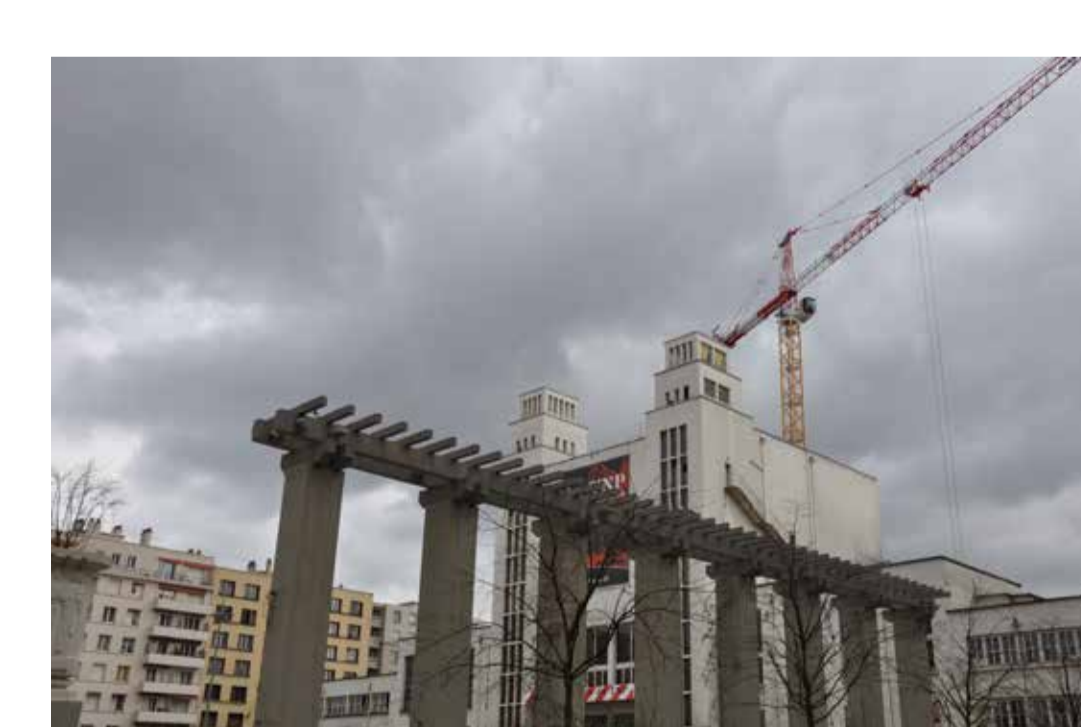
Les Gratte-ciel de Villeurbanne, exceptionnel centre urbain des années 1930 2009