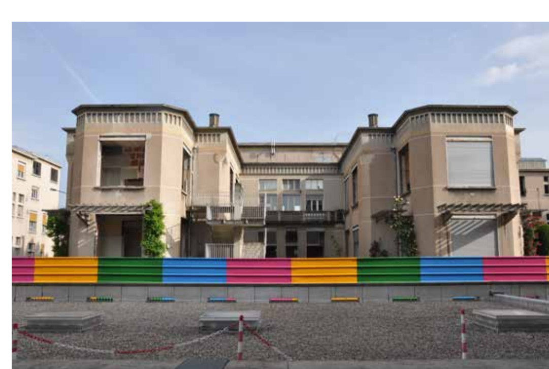
Démolition du pavillon H de l'hôpital Edouard Herriot, architecte Tony Garnier, Lyon 3 e 2015