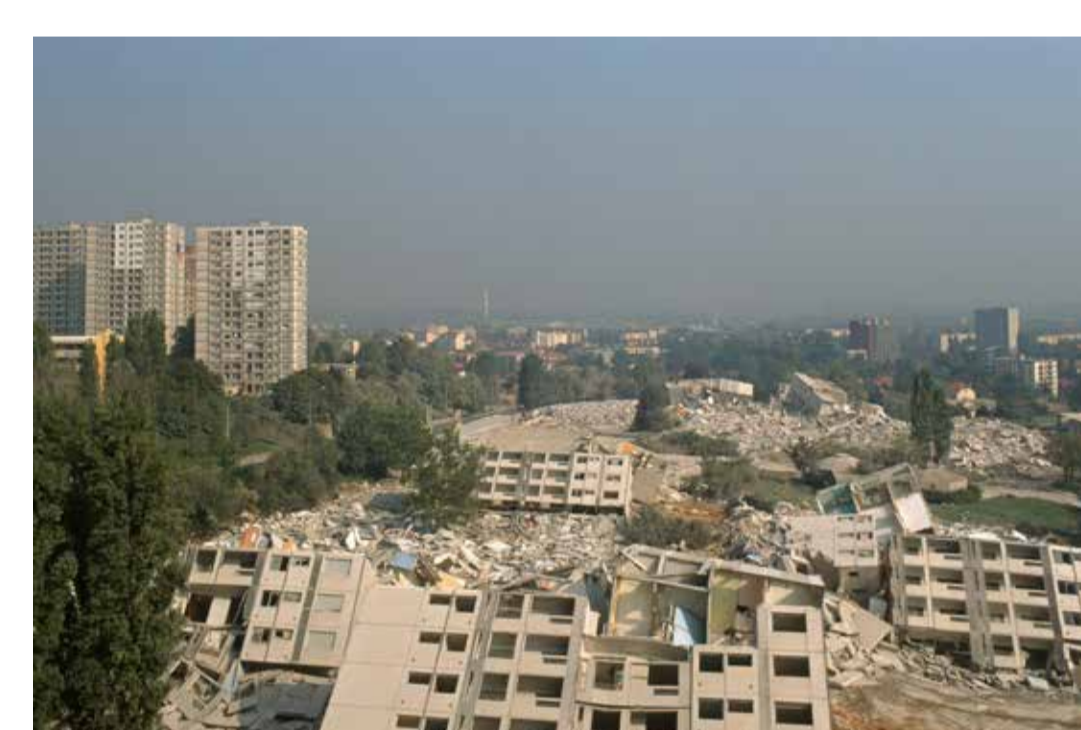
Tours des Minguettes après l'explosion, Vénissieux 1994, diapositive restaurée