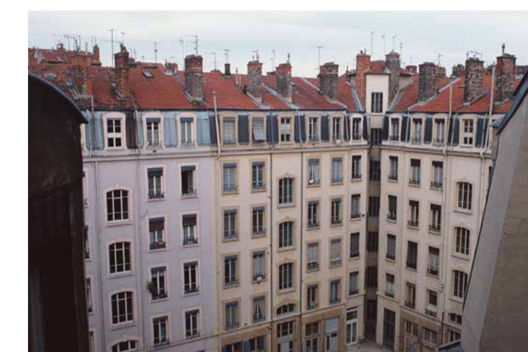
L'« îlot à cour commune », invention des Hospices civils de Lyon. Vue depuis le 11 avenue Maréchal de Saxe, Lyon 6 e 1992, diapositive restaurée