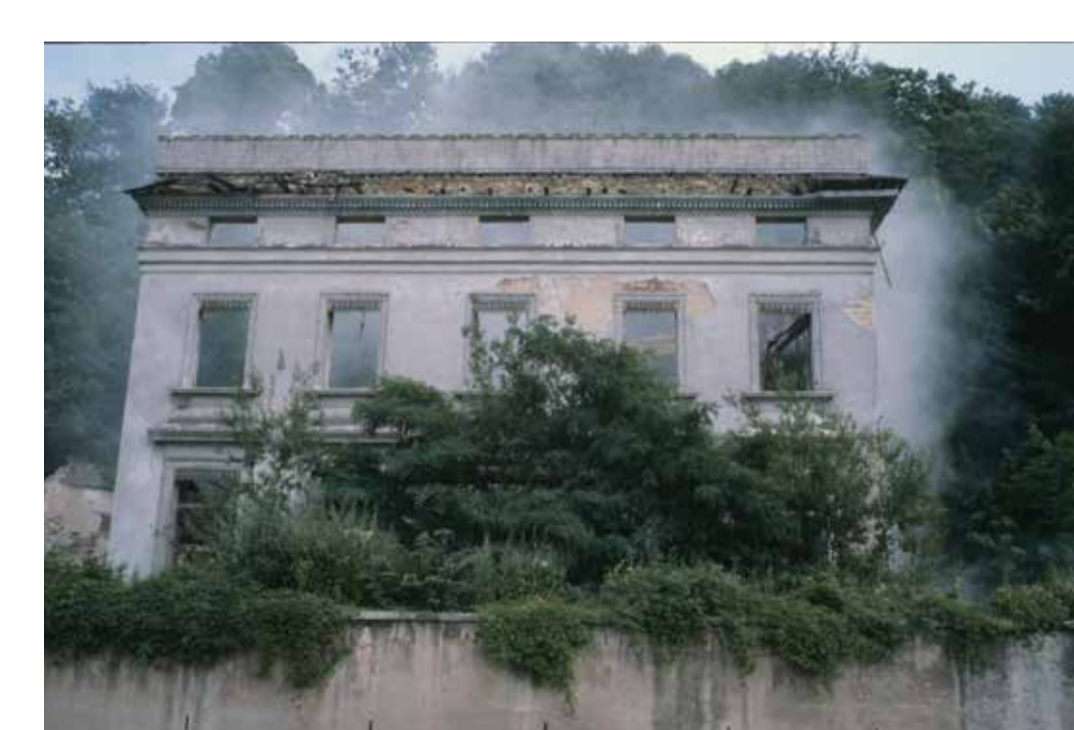
Démolition de la « Jolivette », maison de plaisance du XVIII e siècle attribuée à l'architecte Soufflot, Caluire 1981