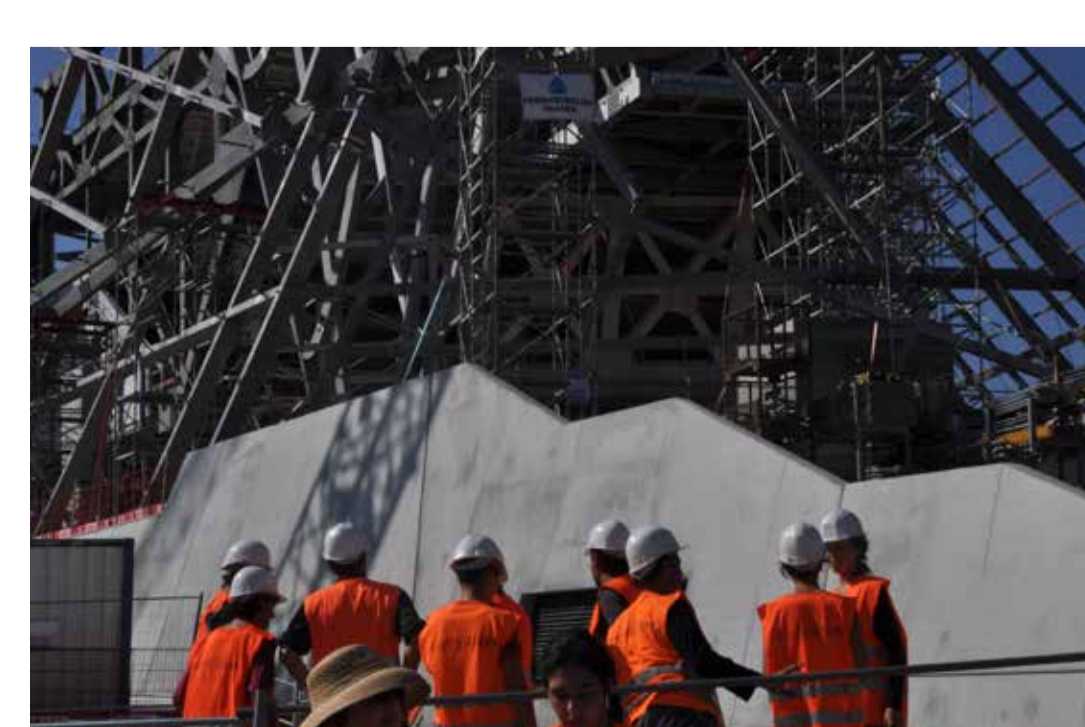
Construction du musée des Confluences, Lyon 2012