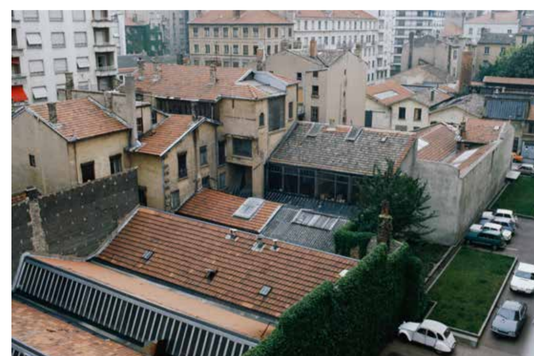
Inventaire des îlots vétustes avant démolition sur la rive gauche du Rhône, Lyon 6 e 1981, diapositive restaurée