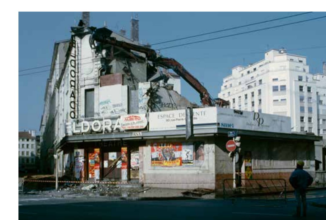
Démolition du théâtre Eldorado pour bâtir un immeuble collectif, Lyon 3 e 1993, diapositive restaurée