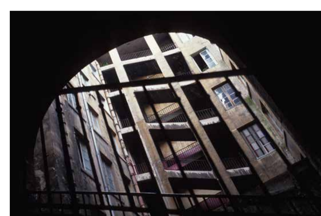
Inventaire architectural et photographique des pentes de la Croix-Rousse en vue de leur protection, Lyon 1 e 1992, diapositive restaurée