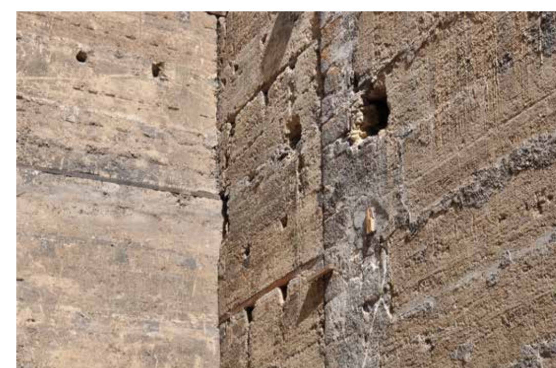
Détail de l'immeuble en pisé, 6 rue du Mail, Lyon 4 e 2017