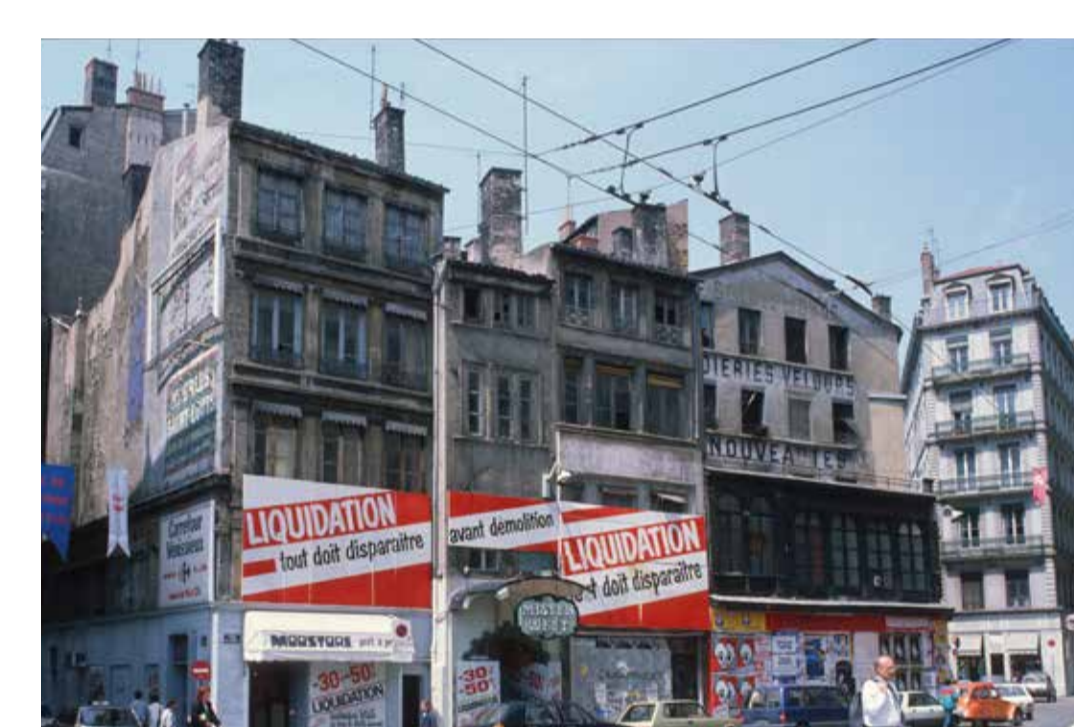
Démolition de la ville historique, les rues Mercière et de la Monnaie, Lyon 2 e 1985, diapositive restaurée