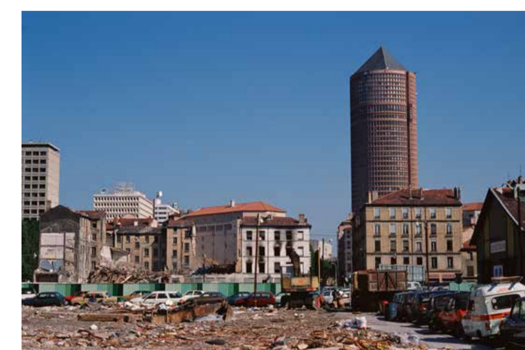
Démolitions de l'architecture vernaculaire pour faire place au palais de justice, Lyon 3 e 1989, diapositive restaurée