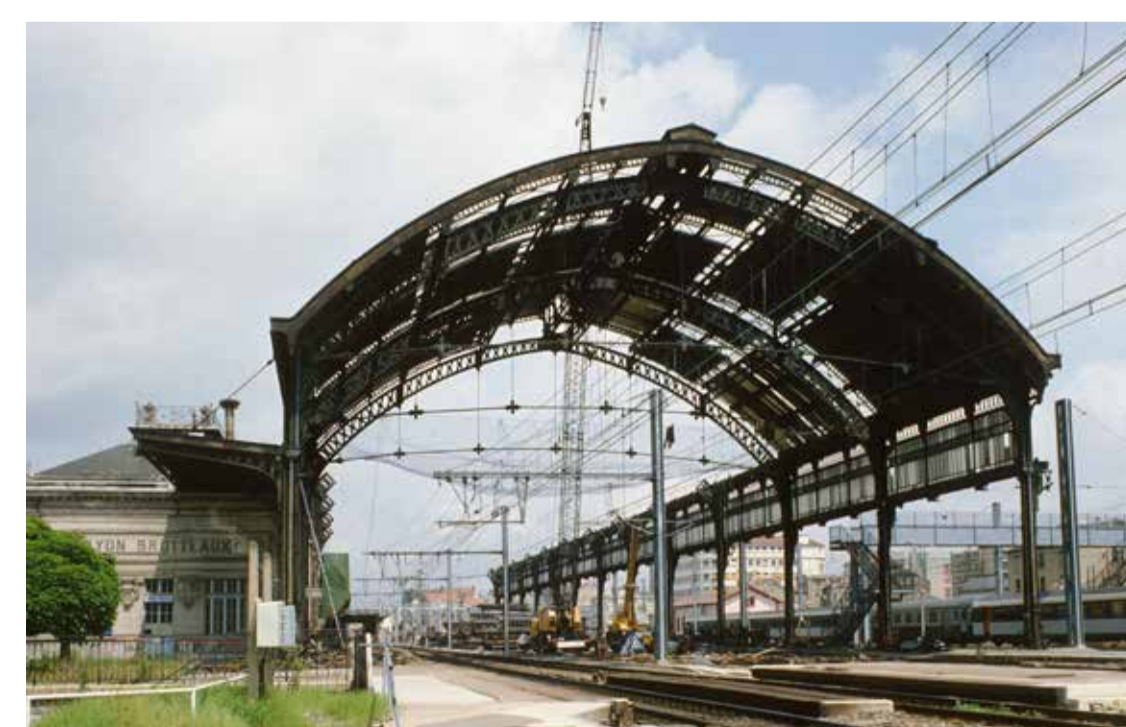
La gare des Brotteaux abandonne sa fonction ferroviaire, démolition de la grande halle métallique, Lyon 6 e 1985, diapositive restaurée