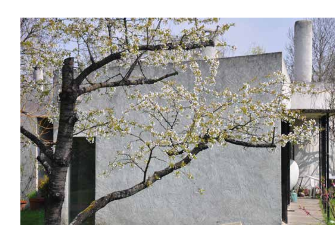
Maison du peintre - architecte George Adilon, Brindas 2010