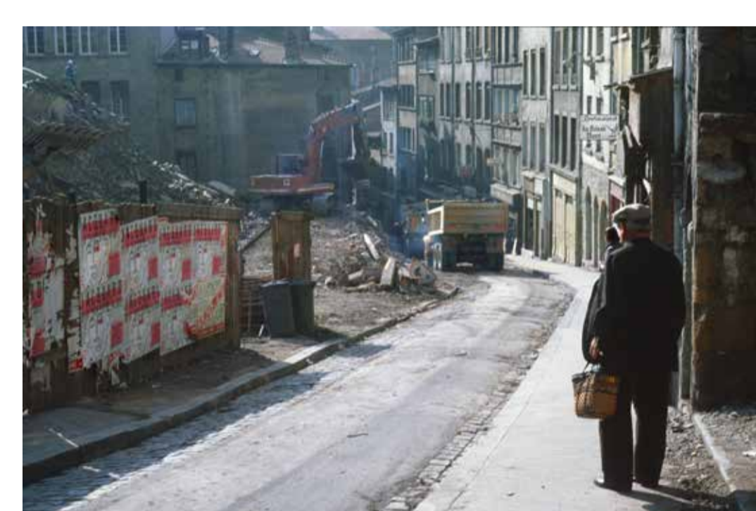
Démolition de la montée de la Grande Côte, Lyon 1 e 1984, diapositive restaurée