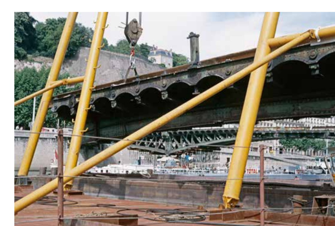
Démolition du pont de l'Homme de la roche suite aux nouvelles normes imposées par la navigation fluviale, Lyon 1986, diapositive restaurée