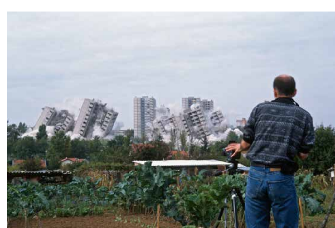
Première démolition en France des grands ensembles des années 1950-1960. Tours des Minguettes pendant l'explosion, Vénissieux 1994, diapositive restaurée