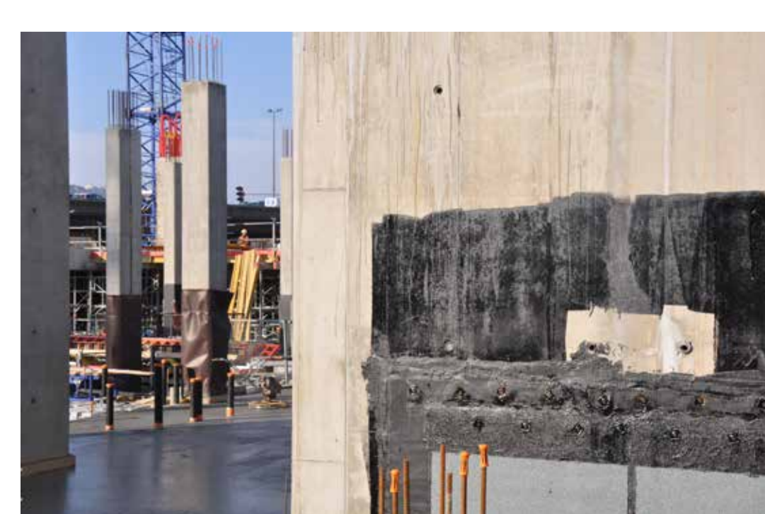
Construction du musée des Confluences, Architecte Coop Himmelb(l) au, Lyon 2 e 2011