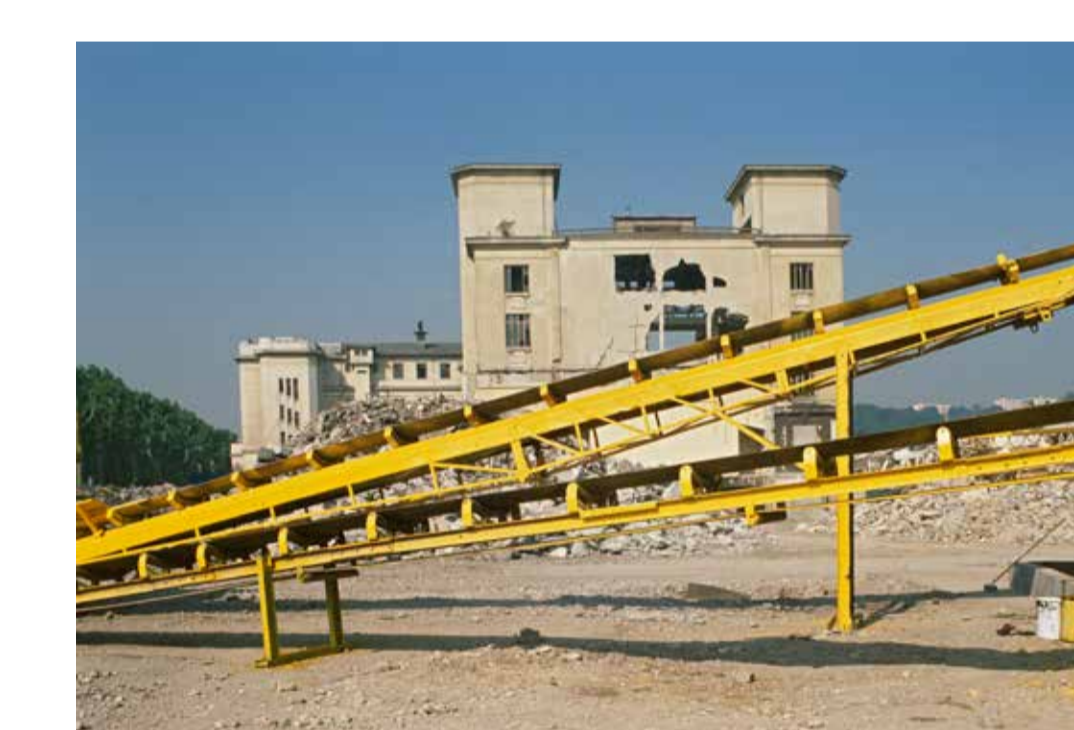
Démolition du Palais de la foire pour édifier la future Cité internationale, Lyon 6 e 1990, diapositive restaurée