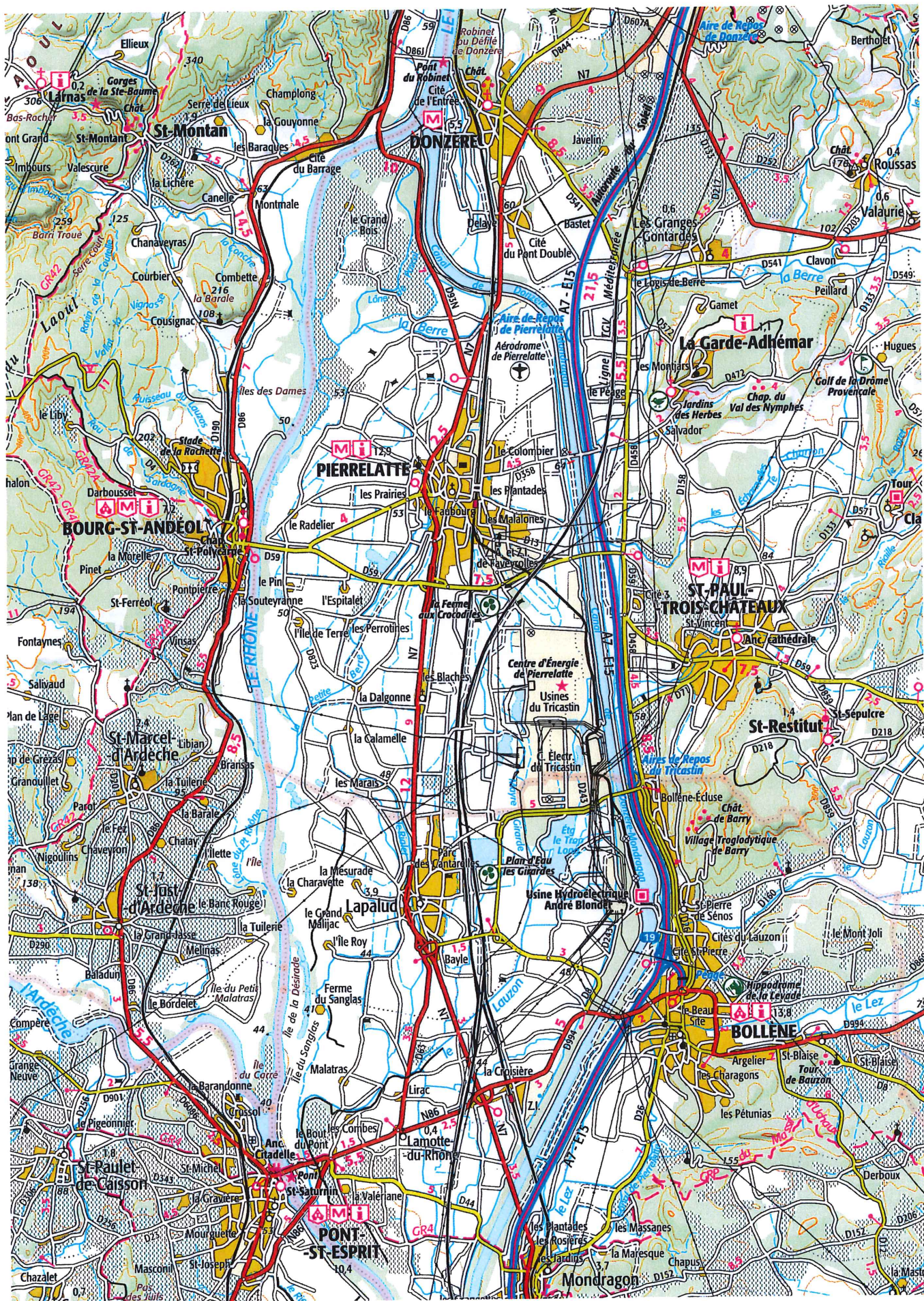
Extrait du SCAN 100 édition 2011 (échelle au 1/100 000)