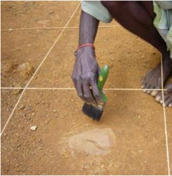
Outils in situ du Paléolithique moyen en voie d'être extraits du sédiment