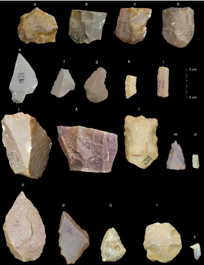
Exemples d'outils typiques du Paléolithique moyen d'Attirampakkam