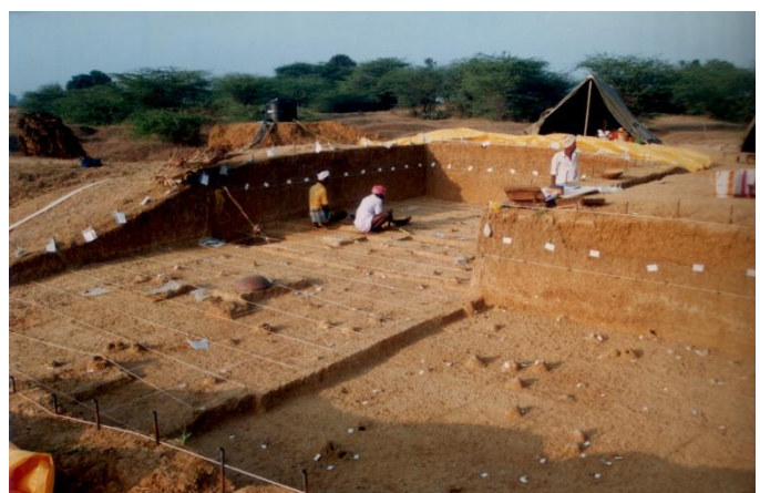
Vue générale des carrés de fouilles au site d'Attirampakkam, montrant la stratigraphie des sédiments qui contiennent la séquence culturelle du Paléolithique moyen